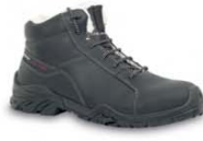
AVALANCHE - S. 21 & 36