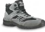
FLORIDA - S. 21