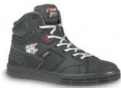
RIDE - S. 10