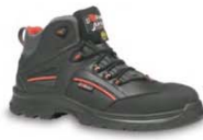
STRONG II - S. 19