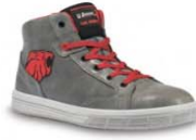
PREDATOR S. 13