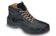
ELCH HOCH - S. 28