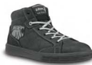
LION - S. 11