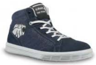
CARAVAN - S. 13