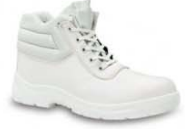
SANI-ECO - S. 32