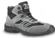
FLORIDA - S. 21