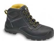
COMFORT ÜBERGR. - S.27

Mahn Marketing & Vertrieb, Birkenweg 6 65439 Flörsheim