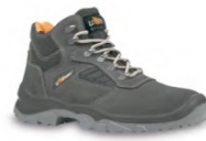
REAL - S. 26