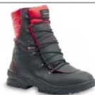
FORCE - S. 30