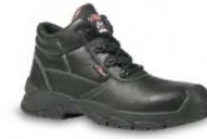
FORTIS II - S. 19 & 27