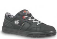
GROOVE - S. 10